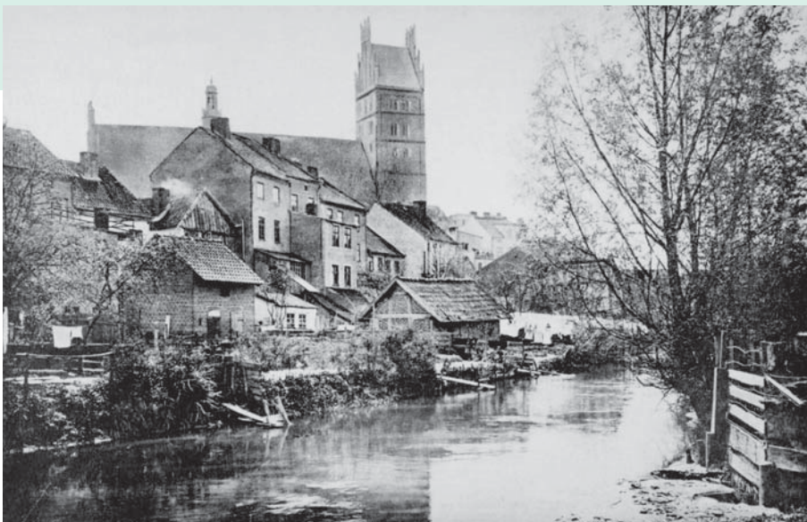
Blick über die kleine Alle auf die Guttstädter Altstadt, um 1914

Dobre Miasto na starej widokówce, około 1900 r. U góry panorama miasta, u dołu kościół ewangelicki i cel podmiejskich spacerów t zw. Waldmühle (Leśny młyn)