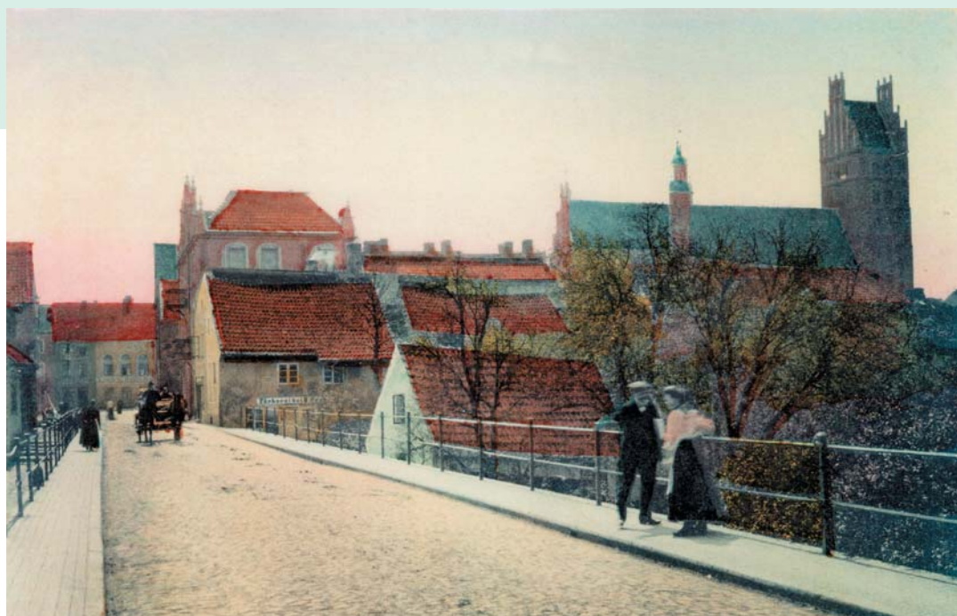
Wormditter Vorstadt mit Blick auf die katholische Kollegiatkirche und die mittelalterliche Bebauung der Stadt, um 1905