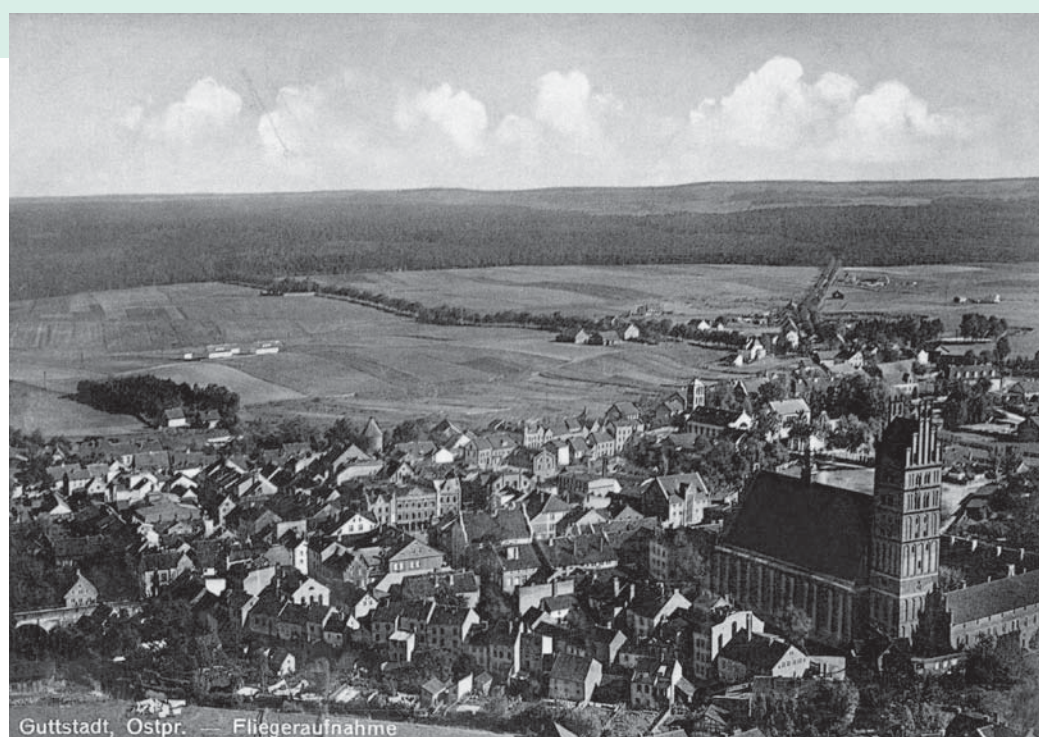
Panorama der Stadt. Fliegeraufnahme, um 1935 Panorama miasta. Zdjęcie lotnicze wykonane około 1935 r.