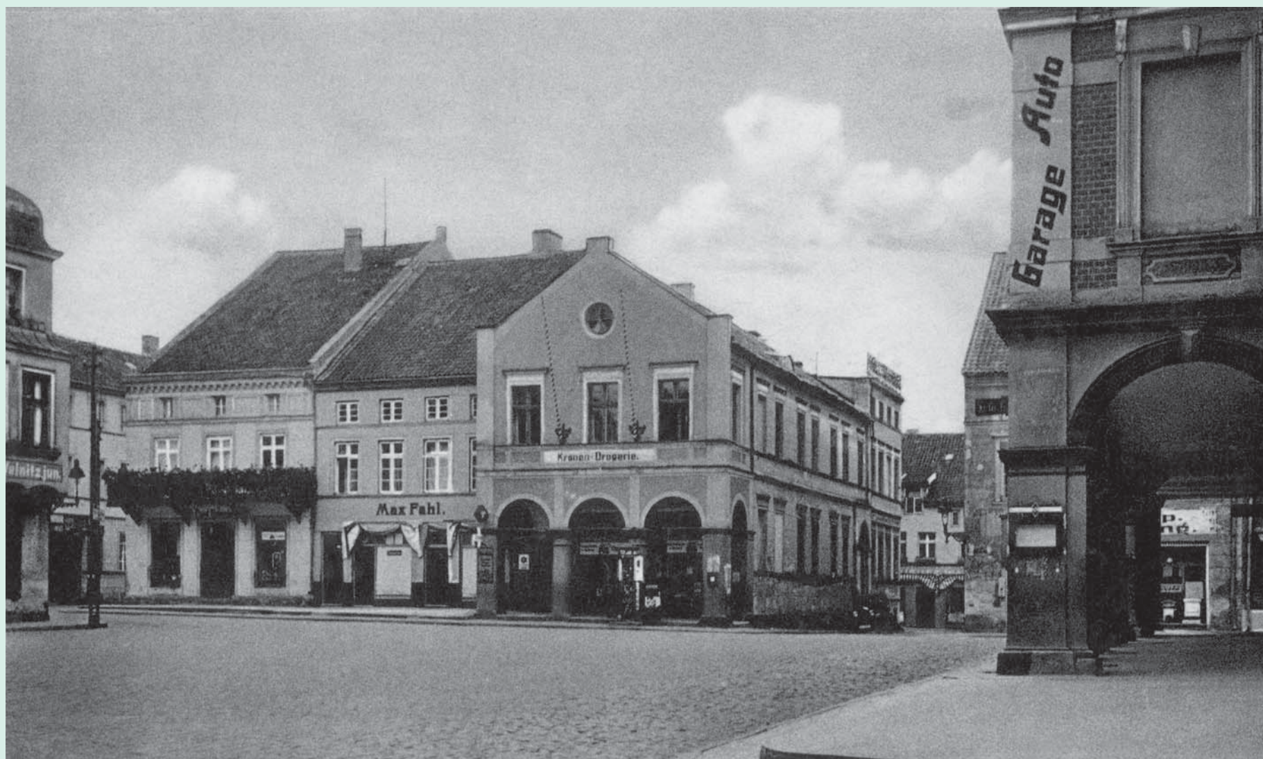
Nordseite des Markplatzes, um 1935. Auf dem Foto von links: das Haus an der Ecke des Markplatzes und der Wormditter Vorstadt mit dem Kolonialwarengeschäft von Kaufmann Paul Hoepfner (Markt 7), dann die Fleischerei von Max Fahl (Markt 8) und das Haus von Anton Kehrbaum mit der Kronen-Drogerie und der Tankstelle davor (Markt 9). Rechts, an der Ostseite des Markplatzes, die Arkaden des Deutschen Hauses