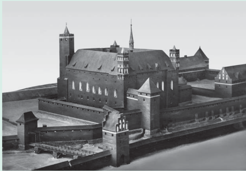
Burg Heilsberg im Mittelalter Zamek Lidzbark w średniowieczu