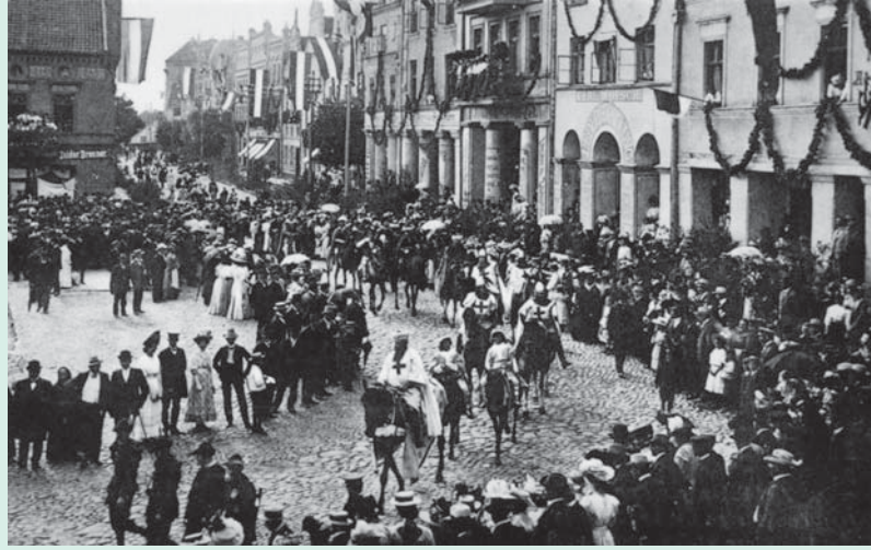
Feierlichkeiten in Heilsberg anlässlich des 600-jährigen Stadtjubiläums Uroczystości w Lidzbarku z okazji obchodów rocznicy 600-lecia miasta