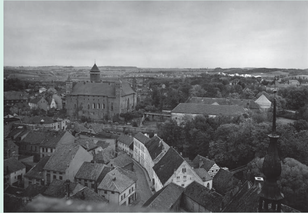
Blick vom Turm der katholischen Pfarrkirche auf die Stadt und das Hochschloss. Die in der zweiten Hälfte des 14. Jahrhunderts erbaute Bischofsburg von Heilsberg galt nach der Marienburg als der bedeutendste Profanbau des Landes. Das hochaufragende, quadratische Backsteinbauwerk hat an der Nordostecke einen massiven, achteckigen Bergfried, die anderen Ecken haben zierlichere Türme. Foto: 1938