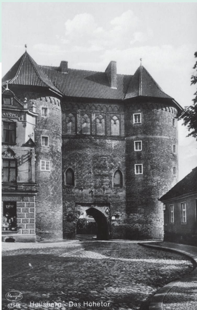
Das Hohe Tor und die Hohentorstrasse / Mackensenstrasse (links) von der Hohentorvorstadt aus gesehen, um 1910.

Das Tor, auch Königsberger Tor genannt, wurde 1474 nach niederländischem Muster erbaut.