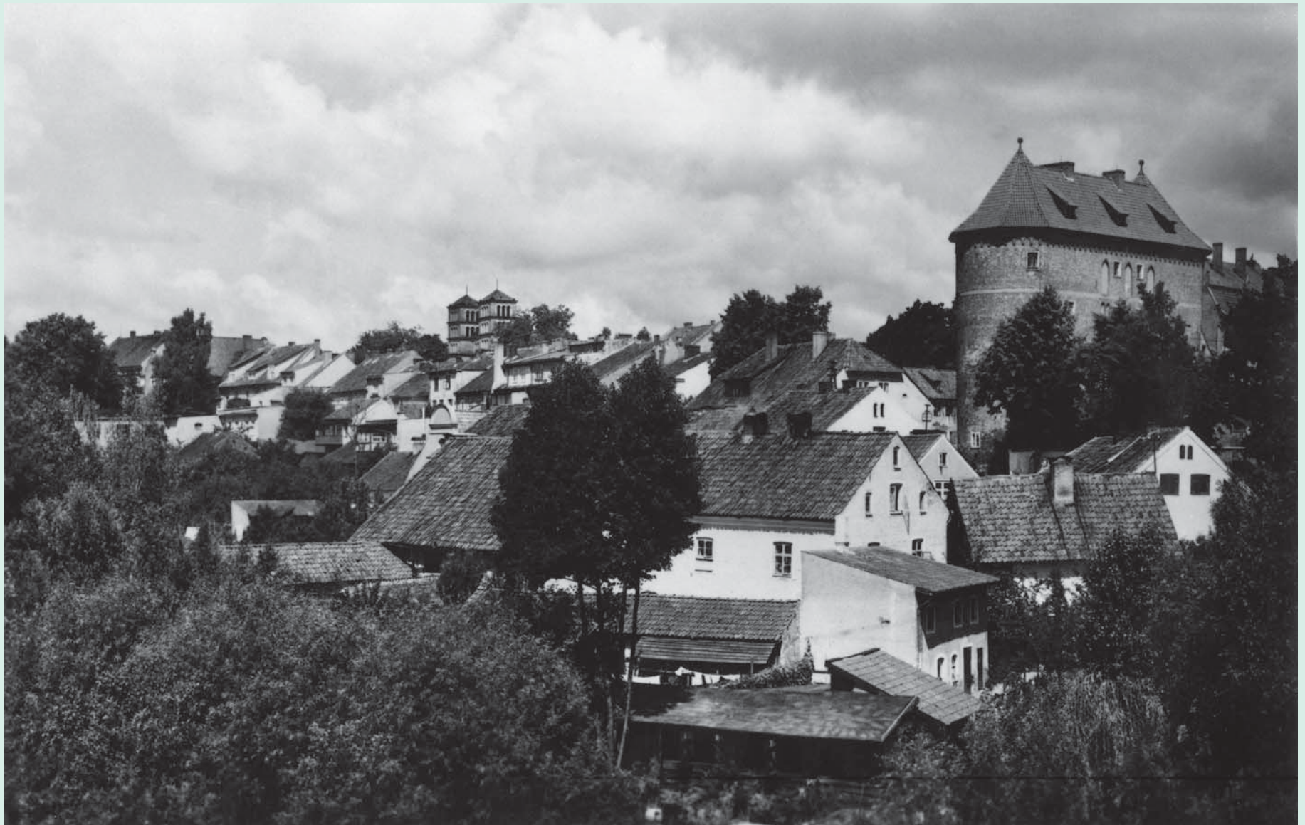
Das Hohe Tor und das Panorama der Stadt. Im Hintergrund links die zwei Türme der evangelischen Kirche, um 1910 Wysoka Brama i panorama miasta. W głębi, po lewej, dwie wieże kościoła ewangelickiego, około 1910 r.